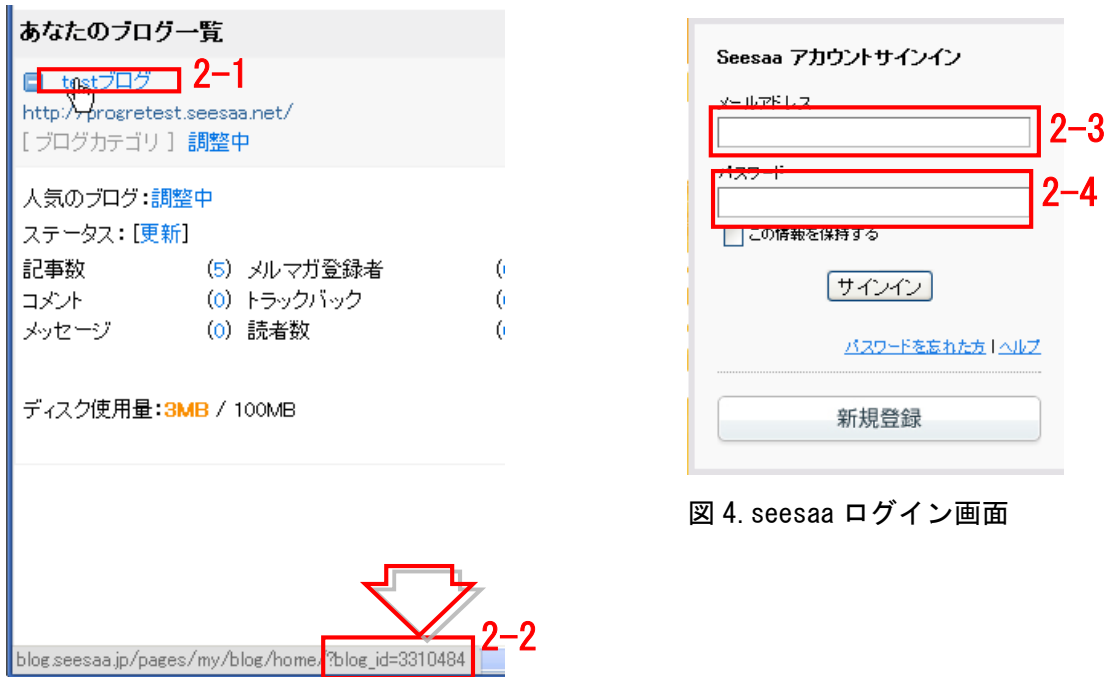
図 3. seesaa 管理画面

パスワード : 図 4 「seesaa ログイン画面」の 2-4 にログイン時に設定するパスワード。