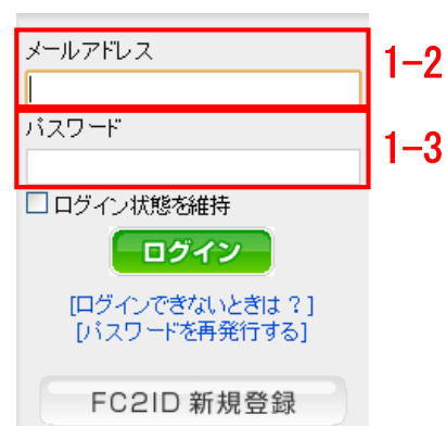
図 2. FC2 ログイン画面