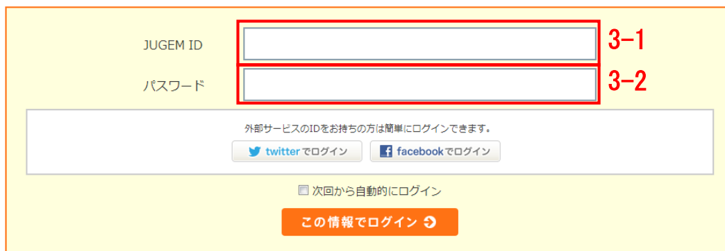
図 5. JUGEM ログイン画面

パスワード : 図 5 「JUGEM ログイン画面」のログイン時に設定する 3-2 のパスワード。