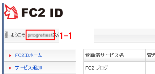
図 1. 管理画面で表示されるユーザ ID

パスワード : 図 2 「FC2 ログイン画面」の 1-3 にログイン時に設定するパスワード。