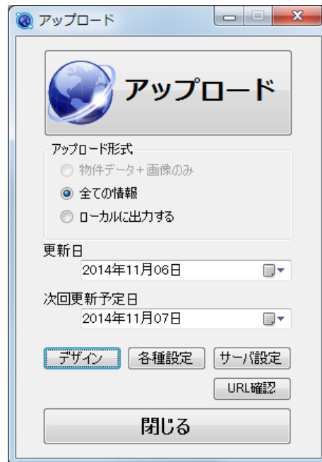
動的ページアップロード画面

@dream を起動し、動的HPアップロード画面で「サーバ設定」ボタンをクリックして「アップロードサーバ設定」画面を表示します。