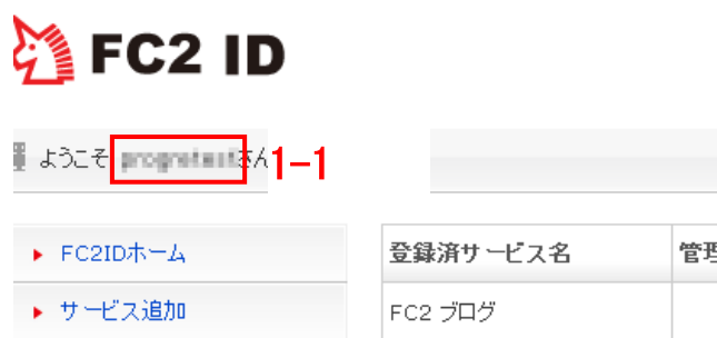
図 1. 管理画面で表示されるユーザ ID

パスワード : 図 2 「FC2 ログイン画面」の 1-3 にログイン時に設定するパスワード。