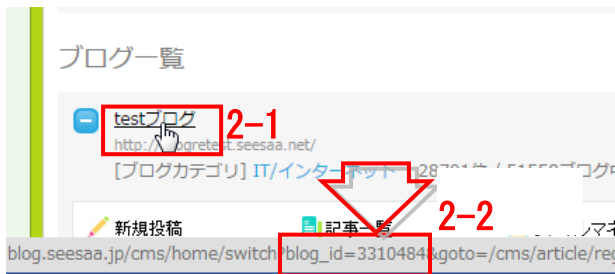
図 3. seesaa 管理画面

パスワード : 図 4 「seesaa ログイン画面」の 2-4 にログイン時に設定するパスワード。