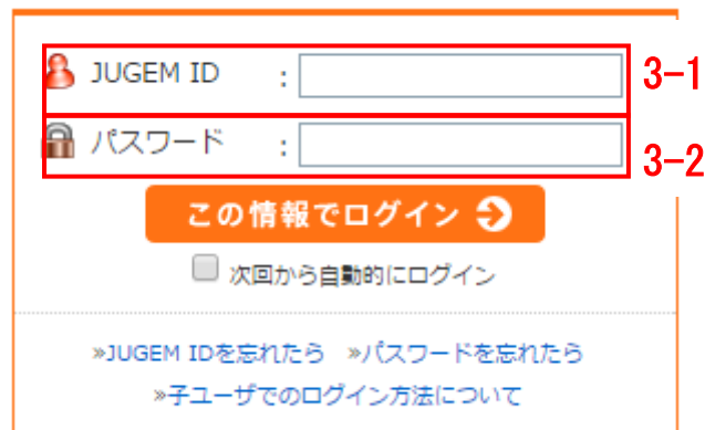
図 5. JUGEM ログイン画面

パスワード : 図 5 「JUGEM ログイン画面」のログイン時に設定する 3-2 のパスワード。