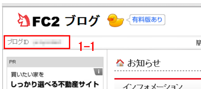
図 1. 管理画面で表示されるユーザ ID

パスワード : 図 2 「FC2 ログイン画面」の 1-3 にログイン時に設定するパスワード。